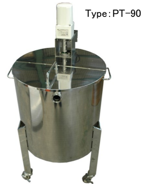
オプション: 90L攪拌装置付き